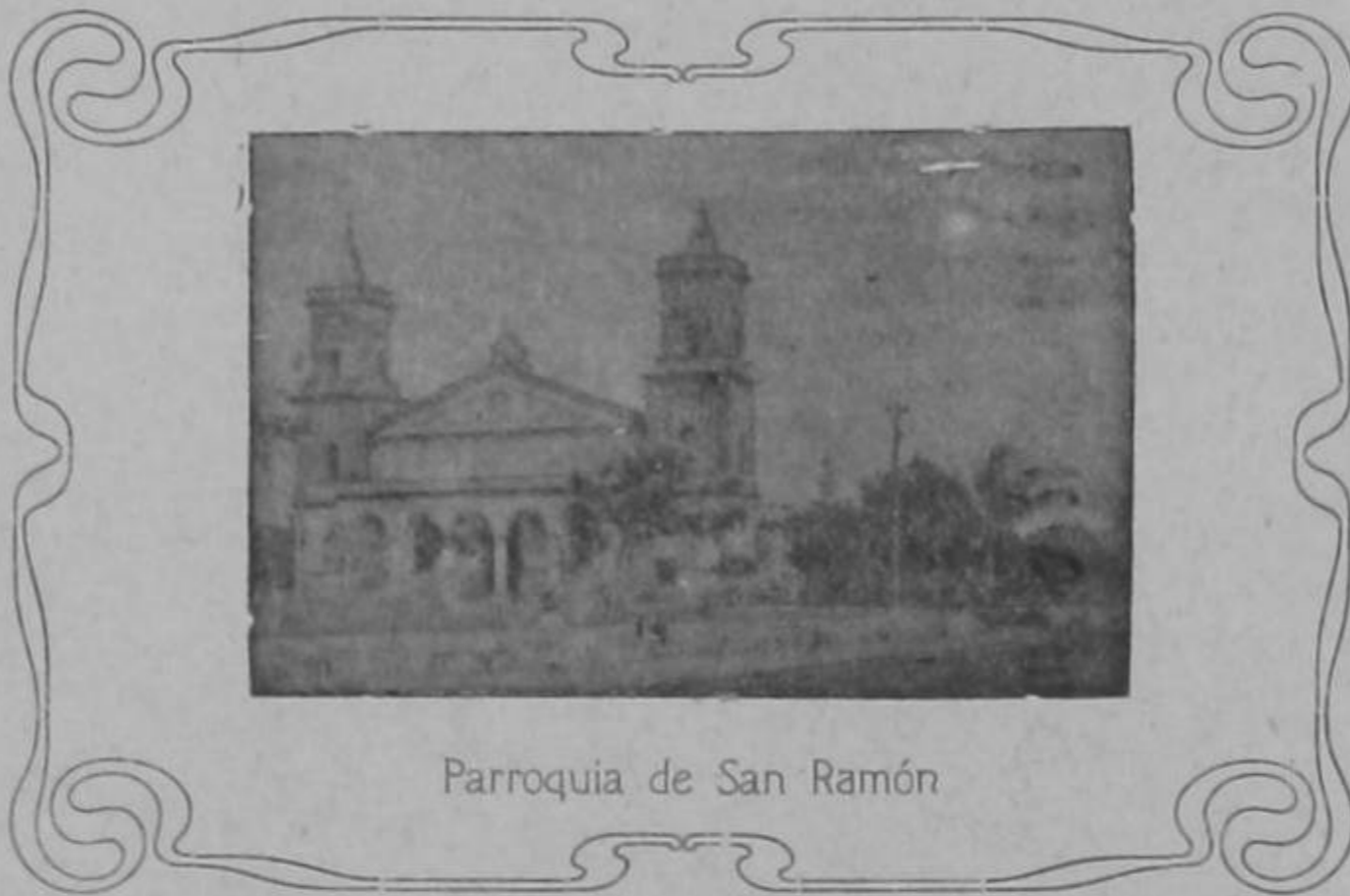
Parroquia de San Ramón

Duerme en Paz, amigo querido y que la dulce tranquilidad del sepulcro bendito que recibió tus preciosos despojos sea el bálsamo que mitigue un tanto la pena que embarga el corazón de tu a-